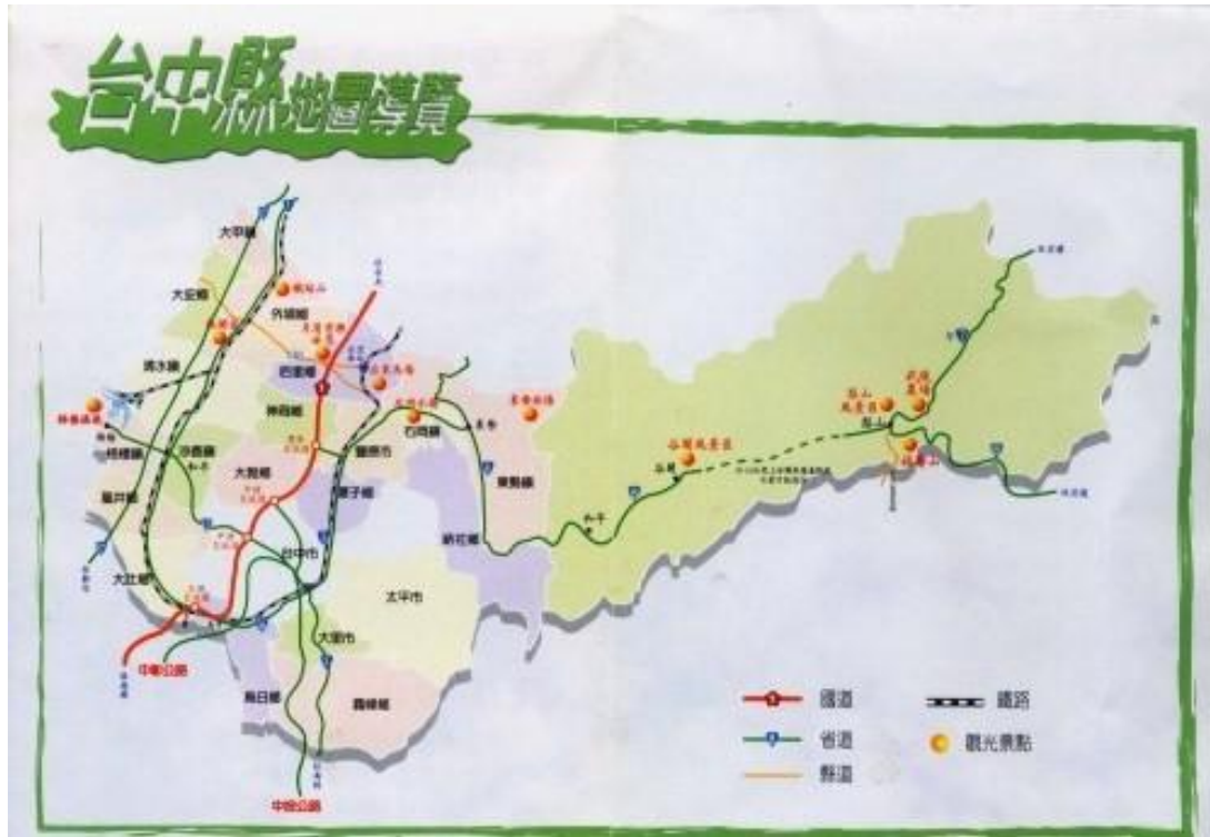
圖 3-3 研究範圍限制（台中縣地圖）