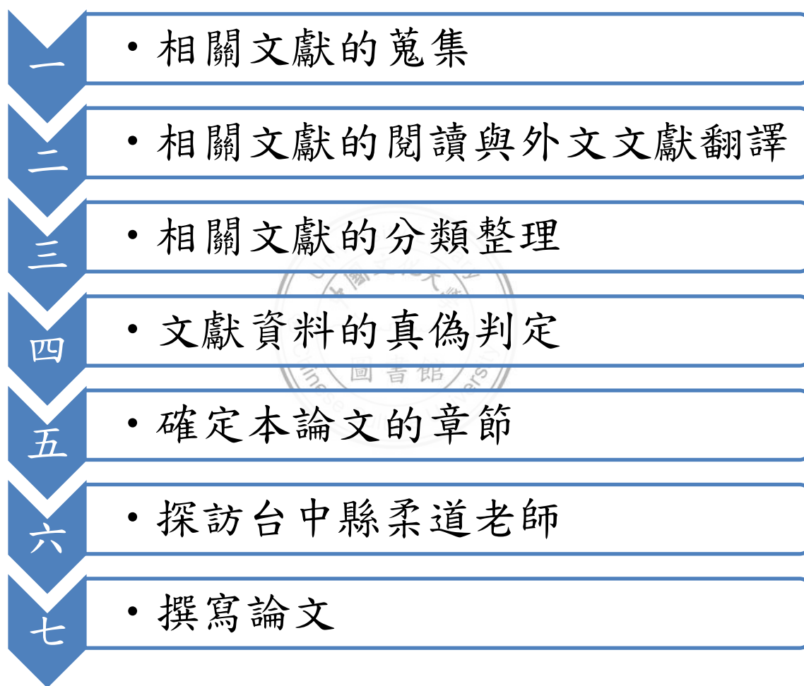
圖 3-1 台中縣柔道運動發展史研究步驟圖

4、台中縣柔道運動的發展必須靠許多人的努力奉獻，才能夠有今日輝煌的成績表現，以訪談方式，證實對台中縣柔道運動發展共獻的事跡與真偽，並藉此感謝對台中縣柔道運動發展共獻其心力的前輩與老師。