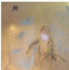
「作品 10」方志偉，《想望系列——望》，彩墨·畫仙板，2008 年 2 月，38×25cm..... 76