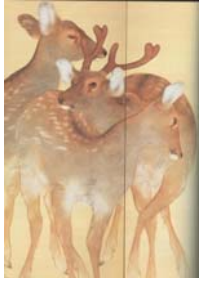
圖 3-14 竹內栖鳳，《和暖》局部，絹本設色，大正 13 年 (1924 年) .....