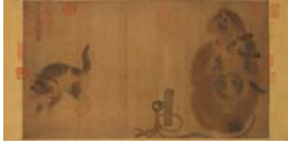
圖 4-1 易元吉《猴貓圖》，北宋，31.9x57.2cm，現藏於臺北 故宮博物院