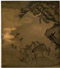
圖 3-10 森狙仙《秋山遊猿圖》江戶時代 164.0×135.8cm 藏 於東京國立博物 館 .....