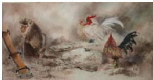
「作品 9」方志偉，《八卦》，彩墨·紙本，2009 年 2 月，140×70cm..... 74