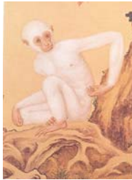
圖 4-2 郎世寧《畫白猿》局部，清，151.2x91.9cm，現藏於 臺北故宮博物院 .....