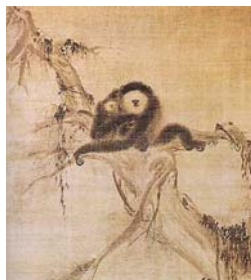
圖 4-4 牧谿，《猿圖》，南宋，現藏於藏於日本大德 寺。 .....