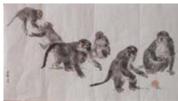
「作品 4」方志偉，《七猴》，彩墨·紙本，2009年 3 月，140×70cm..... 63