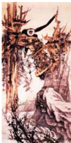
圖3-7 張大千，《老樹騰猿》，1959年，240.5×122cm，紙本水墨設色立軸..... 27