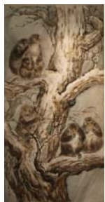
「作品 5」方志偉，《夜猴》，墨彩·紙本，2009年 4 月，140×70cm..... 65