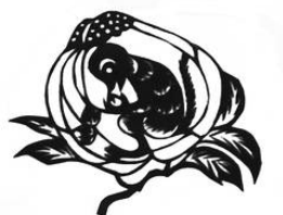
圖 2-1 《桃中猴》剪紙藝術。..... 摘至 http://www1.peopledaily.com.cn/BIG5/paper69/11250/1016935.html