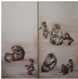
「作品 2」方志偉，《群猴》，彩墨·紙本，2009年 5 月，280×140cm..... 59