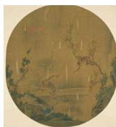
圖 3-2 易元吉，《宋元名人花鳥合璧冊—雙猿》，北宋，32 x34.7cm，藏於臺北故宮博物院。.....