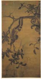
圖3-4 顏輝，《猿圖》，元，131.8×67cm，藏於臺北故宮博物院。..... 24