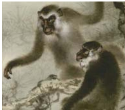
圖 4-3 歐豪年，《雙猿》，局部，1986年，135x 67cm .....