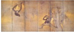
圖 4-6 長谷川等伯，《竹林猿猴圖屏風》，桃山時代 六曲四十一 一双 154.0x361.8cm，現藏於日本京都承天閣美術館。