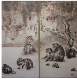
「作品 1」方志偉，《我們這一家》，彩墨·紙本(連屏)，2009年 5 月，280×140cm..... 56