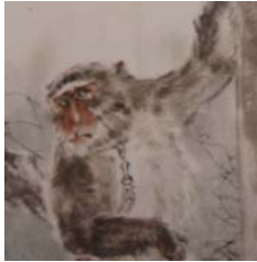
圖 6-6 方志偉《南無阿彌佗猴》局部，2009年5月，70x140cm。