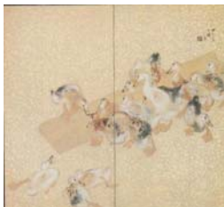
圖 6-2 竹內栖鳳，《群鴨食》，昭和12年(1937年)，藏於京都國立近代美術館。..... 57