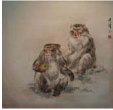
「作品 7」方志偉，《午餐》，彩墨·紙本，2009 年 5 月，70×70cm..... 68