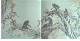
圖 6-4 歐豪年，《五侯》，200x400cm。