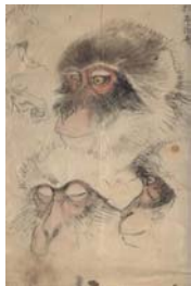
圖 3-13 竹內栖鳳《猿速寫》(寫生本) 明治 22 年(1889 年)。 .....