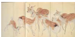
圖 6-3 竹內栖鳳，《夏鹿》，昭和11年（1936年）藏於MOA美術館。..... 57