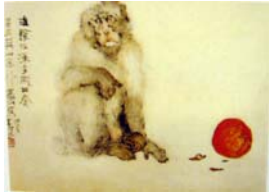
圖 6-5 楊善深《十二生肖-猴》