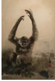
「作品 6」方志偉，《原上棲猿》，墨彩·紙本，2008 年 11 月，70cm×50cm..... 67