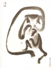
圖3-5 陳其寬，《閒不住2-清理》，1964年，30×23cm..... 26