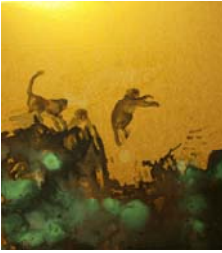
「作品 12」方志偉，《想望系列三—飛翔》，彩墨·畫仙板，80 2009年3月，38×25cm.....