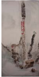
「作品 8」方志偉，《南無阿彌佻猴》，彩墨·紙本，2009 年 5 月，70×140cm ..... 72