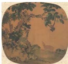
圖 3-1 易元吉，《猿鹿圖》，北宋，25x26.4cm，藏於臺北 故宮博物院。.....