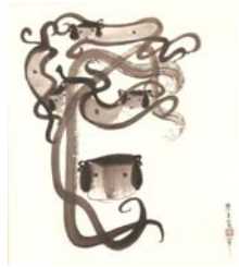
圖3-6 陳其寬，《舞》，1980年，34×31cm..... 26