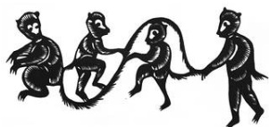
圖 2-2 《跳繩》剪紙藝術。..... 摘至 http://www1.peopledaily.com.cn/BIG5/paper69/11250/1016935.html