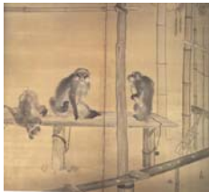
圖 3-12 竹內栖鳳《被飼養的猿和兔》局部 明治 41 年(1908 年)，絹本設色 .....