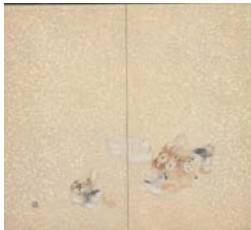
圖 6-1 竹內栖鳳，《鴨眠》，昭和12年(1937年)，藏於京都國立近代美術館。..... 54