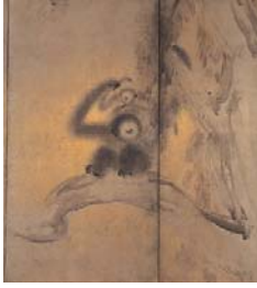
圖 4-5 長谷川等伯，《竹林猿猴圖屏風》，局部，現藏於日本京都承天閣美術館。 48