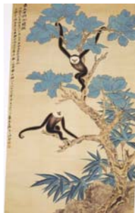
圖3-8 孫家勤，《檨樹雙猿》，1971年，195×110cm，紙本設色..... 28