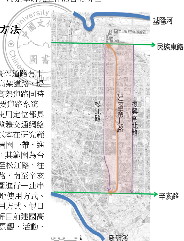
圖 1-1 研究範圍 本研究繪製

台北市內目前所擁有的高架道路有市民大道、新生高架道路、建國高架道路、堤外環河高架道路等。其中建國高架道路同時具有貫穿台北市與擔任聯外主要道路系統的角色，不論是地理位置或是使用定位都具有其重要與特殊的意義。由於整體交通網絡並非本研究所探討之重點，所以本在研究範圍方面，則選定建國高架道路周圍一帶，進行周遭環境的普查與課題分析；其範圍為台北市建國高架道路為主，往西至松江路，往東至復興南北路，北至民族東路，南至辛亥路。以這四條路所圍塑出的範圍進行一連串的普查與分析。其中包括了土地使用方式、產業分析、高架道路底下的使用方式、假日花市的使用現況等等。藉此了解目前建國高架道路目前的使用現況，與對景觀、活動、環境上的衝擊。