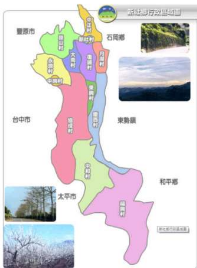
圖 1-2-1 新社鄉行政區域圖

以台中縣新社鄉協成村為研究空間範圍，協成村屬山村型農村聚落，面積 11.89 平方公里。因協成村已是新社香菇知名產地，而村內規劃香菇商圈，於當地銷售在地產業，擁有「自產自銷」的優勢，故為本研究選定之研究個案。