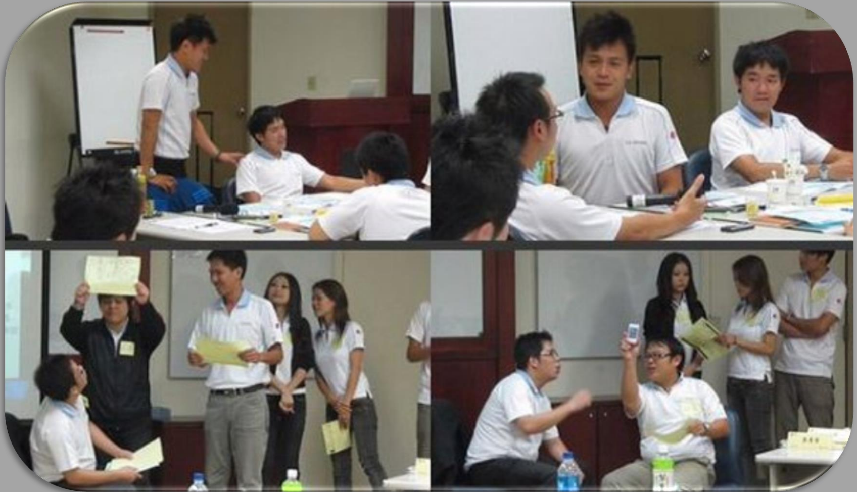
韓國數位家電品牌「Sell-Out」銷售演練