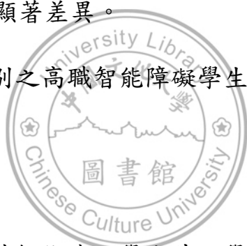
表 四-5 不同性別之高職智能障礙學生其就學需求之 t 檢定